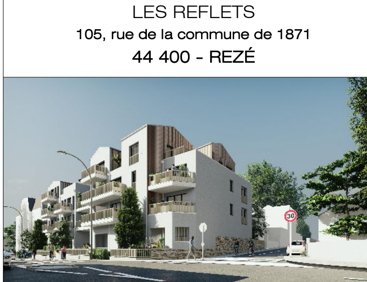
S.C.C.V LES REFLETS