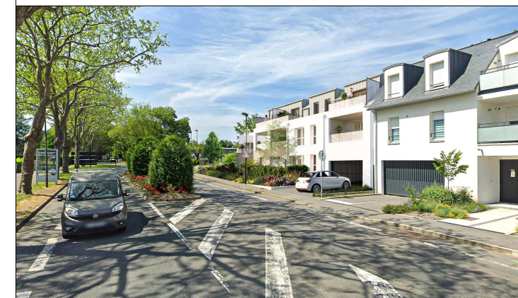
S.C.C.V "LE JARDIN 126"

LE JARDIN 126 126, rue de Bretagne 44880 - SAUTRON